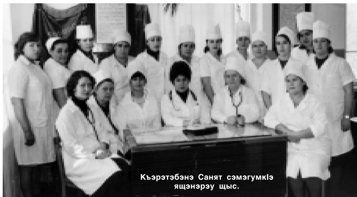
Кьэрэтэбэнэ Санят сэмэгумкIэ яцэнэрэу шыс.

6 ащ сыщеджагь. Институтым ауж хэку кIэлэцыкIу сымэджэщым врач-интернэу Iоф-