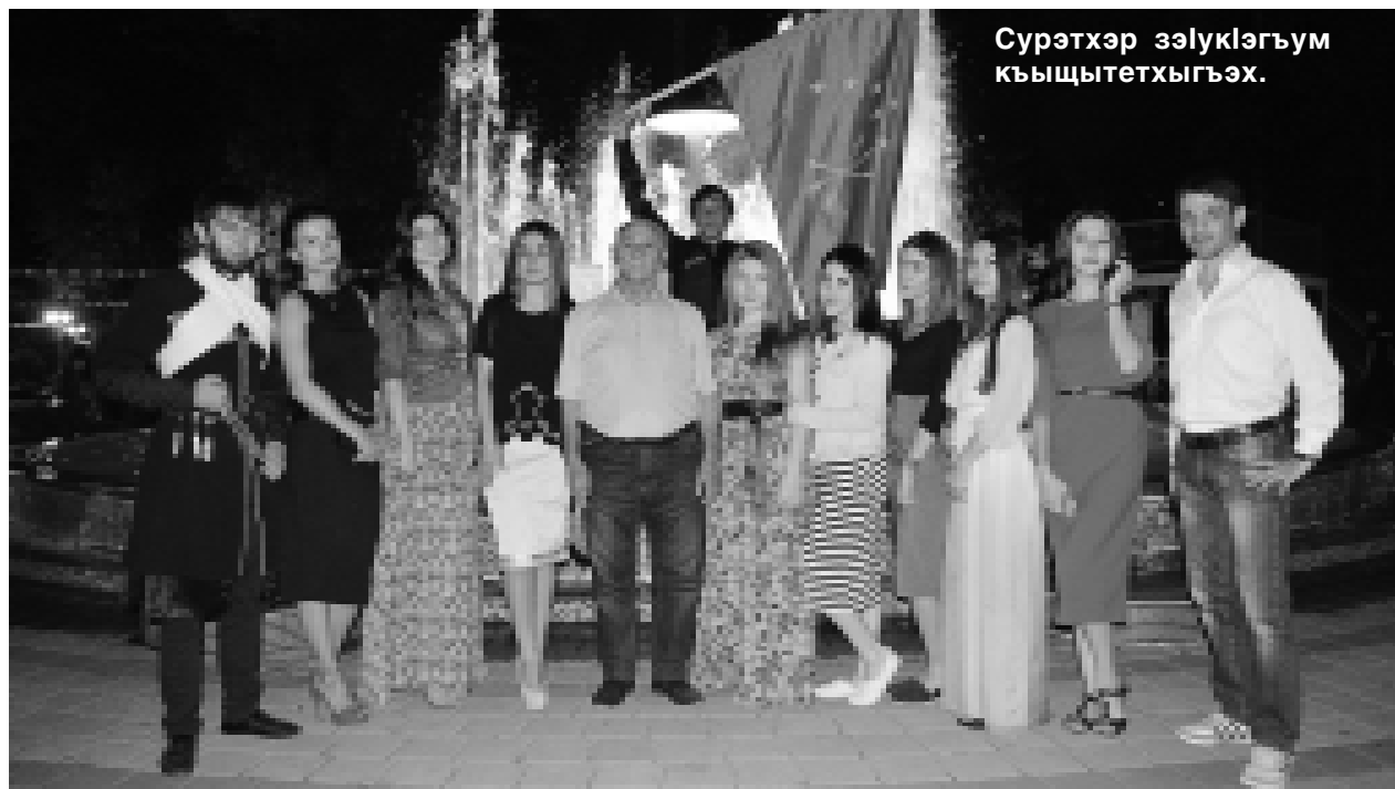
Сурэтхэр зэлуккыгъум къыщытетхыгъэх.