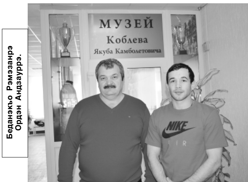
Беданкьо Рэмэзанрэ Ордэн Андзауррэ.