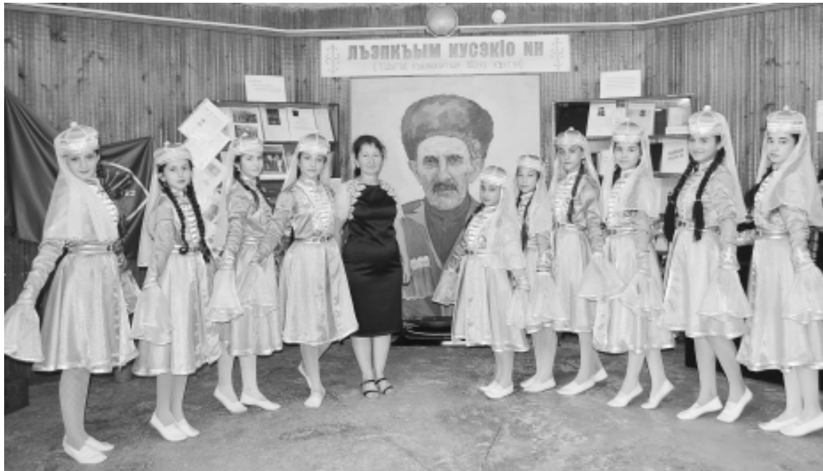
Ансамблэу «Къуаджэм инэфыльэхэр».

Адыгэ шъуашэм и Мафэ Юныгъо мазэм и 28-м тиеспубликэ шыкloшт. А. Иныхур яхудожественнэ пащэу клэлэеджа-клохэр мэфэклым шыуджыщтых, адыгэ шъуашэм зэрэрыгушохэрэр зэхэхьэхэм къащашыгъэхэу.