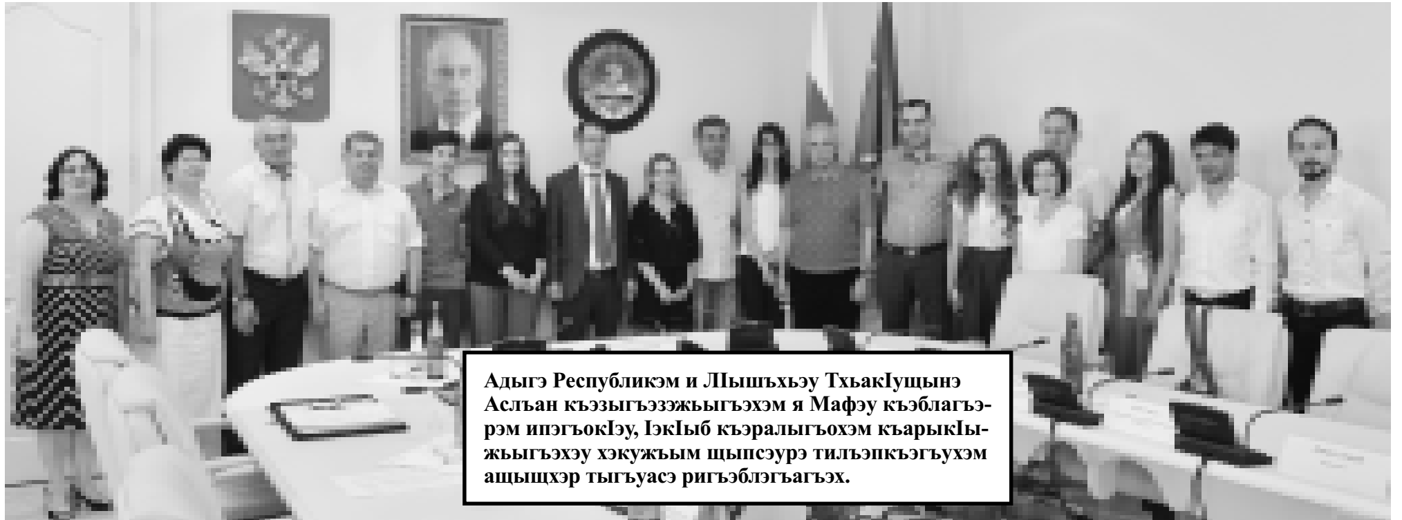
Адыгэ Республикэм и Лышхъэу Тхьаклуцынэ Аслъан къэзыгъээжыгъэхэм я Мафэу къэблагъэрэм ипэгъоклэу, Ізкыб къэралыгъохэм къарыкыжыгъэхэу хэкужым щыпсэурэ тильэпкэзгъухэм ащыщхэр тыгъуасэ ригъэблэгъагъэх.

Адыгэ Республикэм и Правительствэ игъээт