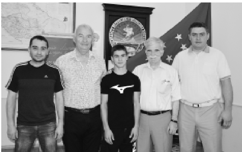
ЦыкIу Рэмэзанэ азыфагу ит.