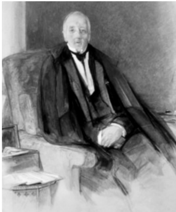
Льюис, Дж. Портрет виконта Джона Понсонби, около 1841 г.

При посредничестве Франции и Англии наступление египтян было остановлено. 4 мая 1833 г. в Кютахье был заключен мир между Турцией и Египтом. Это не был обычный мирный трактат между странами, поскольку Египет продолжал считаться частью державы Османов. Последовал фирман султана Махмуда II (1808 – 1839), которым он отдавал под управление Мухаммеда Али Египет, Сирию, Аравию, Судан, Палестину, Киликию и Крит. Оказалось, что империя вассала больше и богаче, чем империя сюзерена.