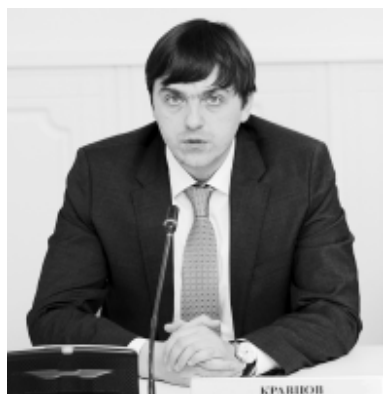
еджэплэ хыбэйхэр шагъэгъэ-зэщтых.

Зэлуклэм хэлэжыагъэх министрствэм илофышлэхэр, гъэсэнэгъэм игъэлорышлэлэхэм, апшъэрэ ыккы гурыт еджаплэхэм япащэхэр.