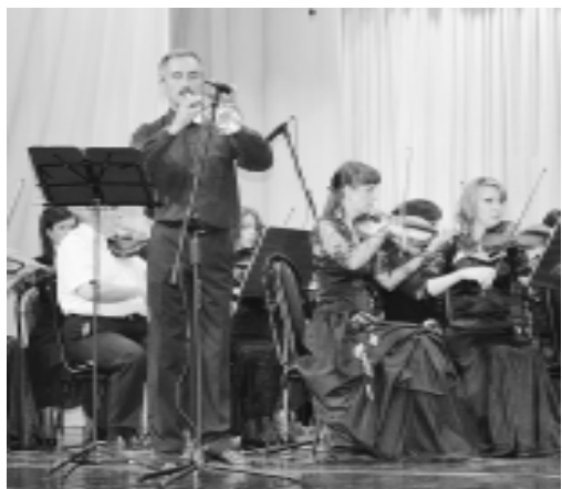
Сурэтыр концертным къыщытырагъыгъ.