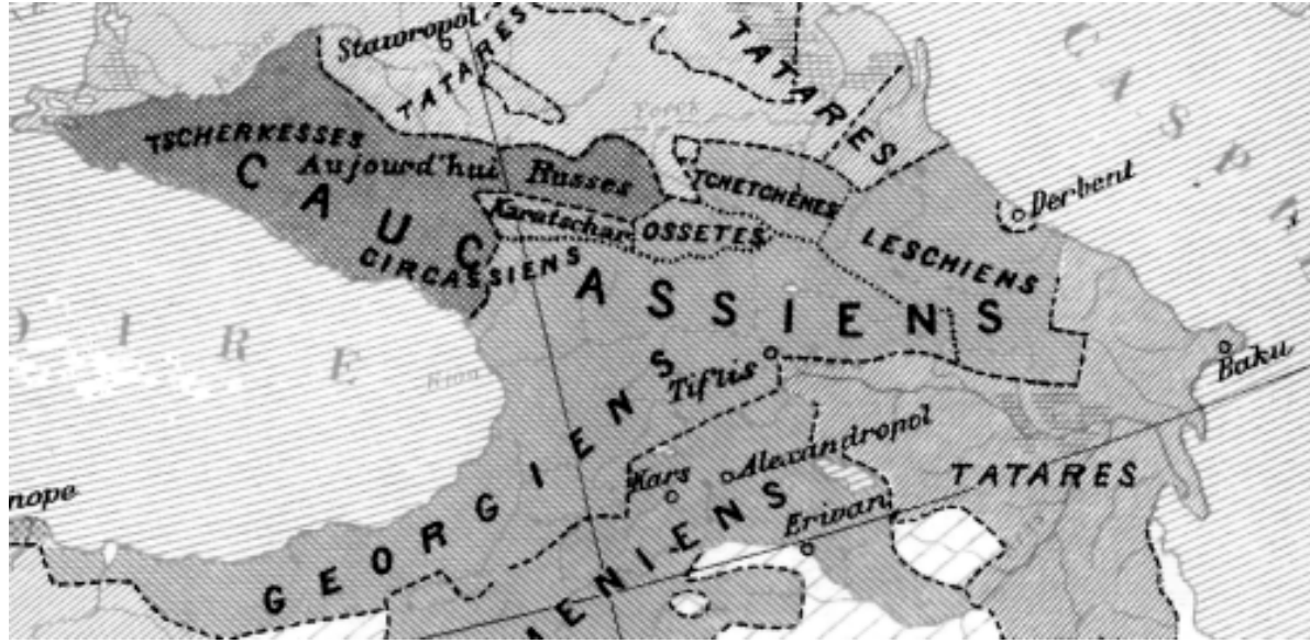
Этнографическая карта Европы. Париж, 1885 г. Фрагмент. Карта зафиксировала факт почти полной замены населения: «Черкесы. Ныне русские». Carte Ethnographique de L'Europe // La Geographie militaire de A. Marga. Paris, 1885.

После окончательного вытеснения греков из Анатолии