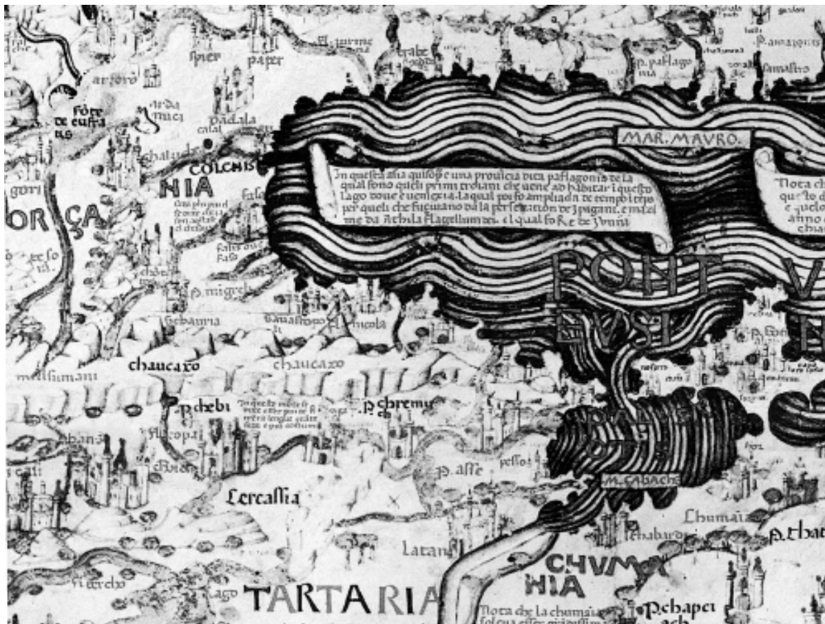
Знаменитая круглая «Карта мира» (Marratondo) венецианского монаха Фра Мауро, созданная в соавторстве с венецианским картографом Андреа Бьянко в 1459 г., содержит если не первое, то, во всяком случае, одно из первых указаний о существовании на Северо-Западном Кавказе страны Черкесии (Circassia). Это название нанесено меньшим шрифтом, чем Татария (Tartaria) и отделено от нее рекой. По соседству с Черкесией отмечена крупная венецианская колония Тана (Latan). ( http://www.kartap2.narod.ru/mfra_mauro.htm ).