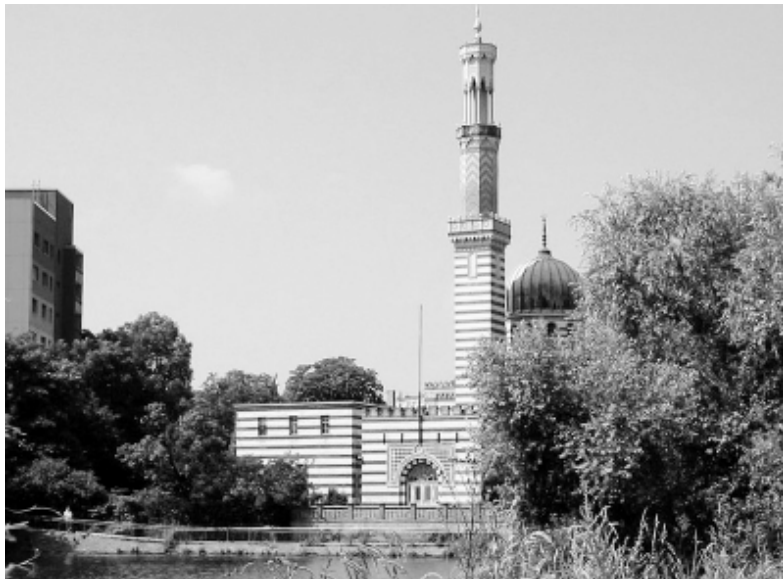
Здание паровой машины в форме мамлюкской мечети на берегу Хафеля. Дворцово-парковый комплекс Сан-Суси, Потсдам. 1842 г.

Согласно У. Мьюру, обстоятельства прихода к власти Хушгадама таковы. 30-летний сын Инала Ахмад правил не более полугода.