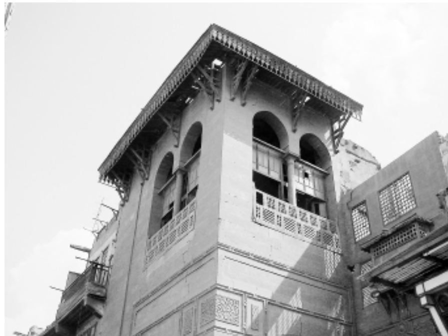
Викала (каравансарай) Каитбая, Каир

Из Аданы Джем, сопровождаемый своей матерью Чичек-Хатун, прибыл в Алеппо и в конце сентября 1481 г. они оказались в Каире. Султан Каитбай принял Джем со всей торжественностью. Из Каира Джем совершил паломниче-