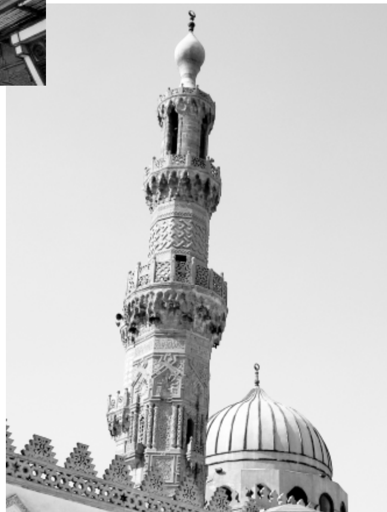
Минарет Каитбая в ал-Азхаре, Каир