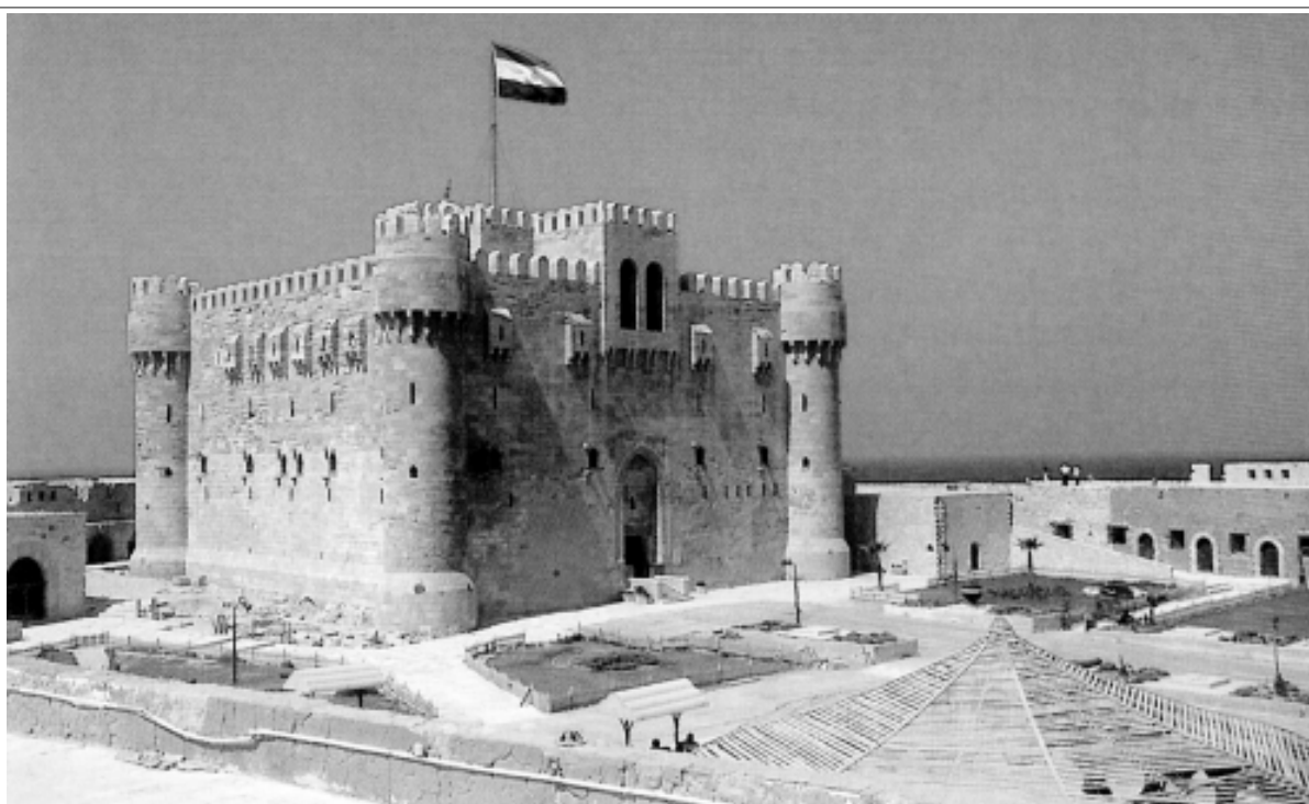
Форт Каитбая в Александрии

Между тем, мать Джема Чичек-Хатун все еще оставалась в Каире. Каитбай периодически писал госпитальерам Родоса, чтобы они отправили к нему Джема. Но рыцари отвечали отказом. После начала войны с османами, в 1485 г. Каитбай усилил давление на рыцарей, а в 1487 – 1488 гг., через посредничество Лоренцо Медичи, обратился к французскому королю Карлу VIII, предложив 100 тысяч золотых дукатов за возвращение Джема в Каир. Но Каитбая совершенно нехотели перебить папа Иннокентий VIII, наивно полагавший мобилизовать европейцев на новый крестовый поход против османов. В марте 1489 г. Джема дос-