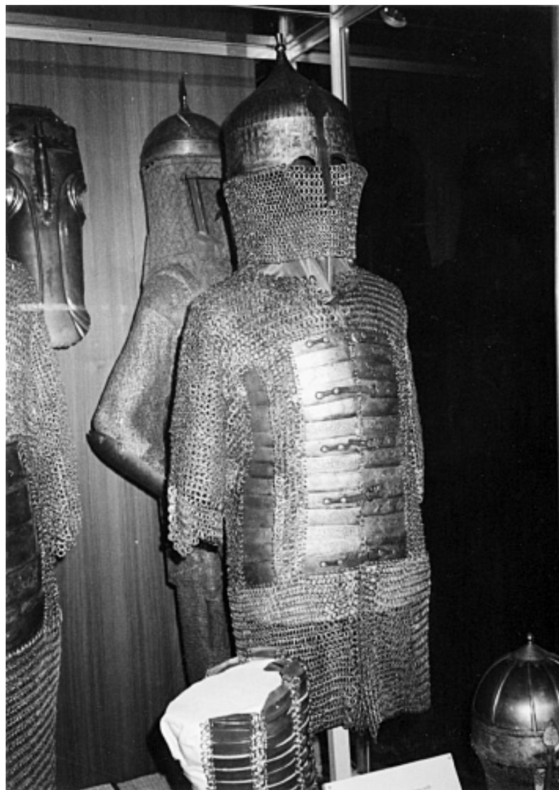
Кольчато-пластинчатый доспех мамлюков.

Во второе правление ан-Насира Мухаммада из черкесских мамлюков выдвинулись эмиры сотен (это высший военный