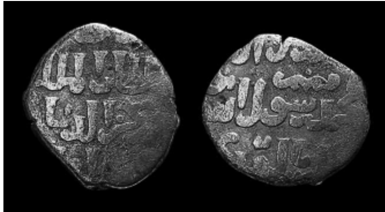
Монеты Байбарса II. См.: http://islamiccoins.ancients.info/mamluk/alMuzaffarBaybarsII.htm