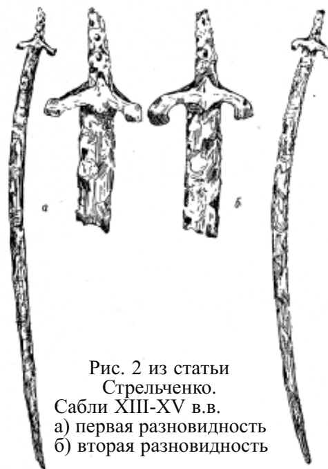
Рис. 2 из статьи Стрельченко. Сабли XIII-XV вв. а) первая разновидность б) вторая разновидность