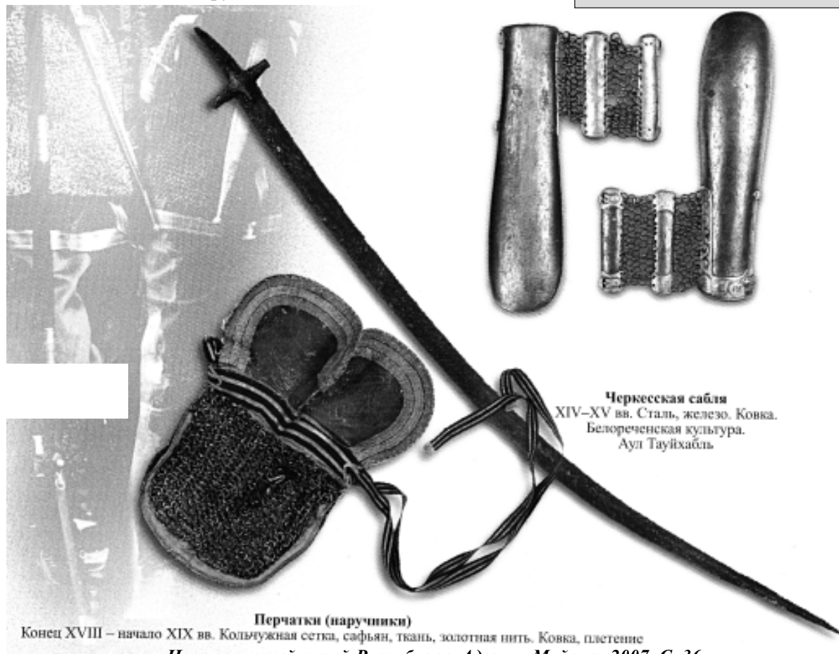
Черкесская сабля XIV-XV вв. Сталь, железо. Ковка. Белореченская культура. Аул Тауыхайль.