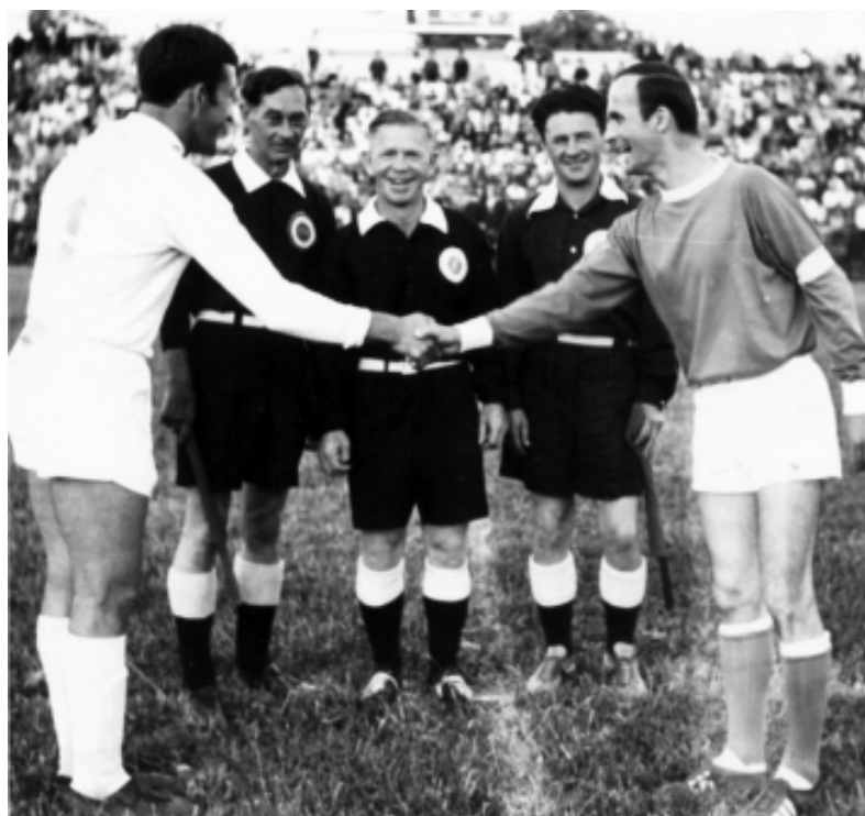
Суретым итыр: Виктор Калешиныр агуэгъукьлэ щыт.

Калешинхэм яунагъо зэнэкьо-кьум щылагъ, зэлуагъэхэм ахэ-