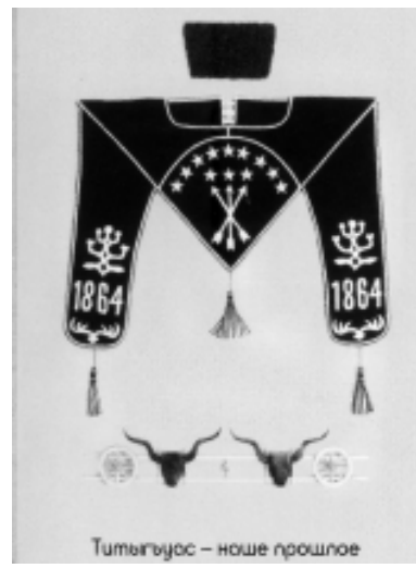
Тимешигъос – ноше прошлое

Адыгэхэр дунаим нахышлоу шашлэнхэр хэта зэлытыгъэр? Упчлэм иджэуап къэгъотыгъошоп. Арэу щытми, Адыгэ Республикэм культурэмкIэ изаслуженнэ IофышIэу СтIашьу Юрэ фэдэхэм уакырыпIы зыхъукIэ, лъэпкъым итарихъ, ишэн-хабзэхэр цыфмэ зэрэбгъэшIэштхэ шыкIэхэр нахышлоу къэгъотынхэ плъэкIыштIэу олтыт.