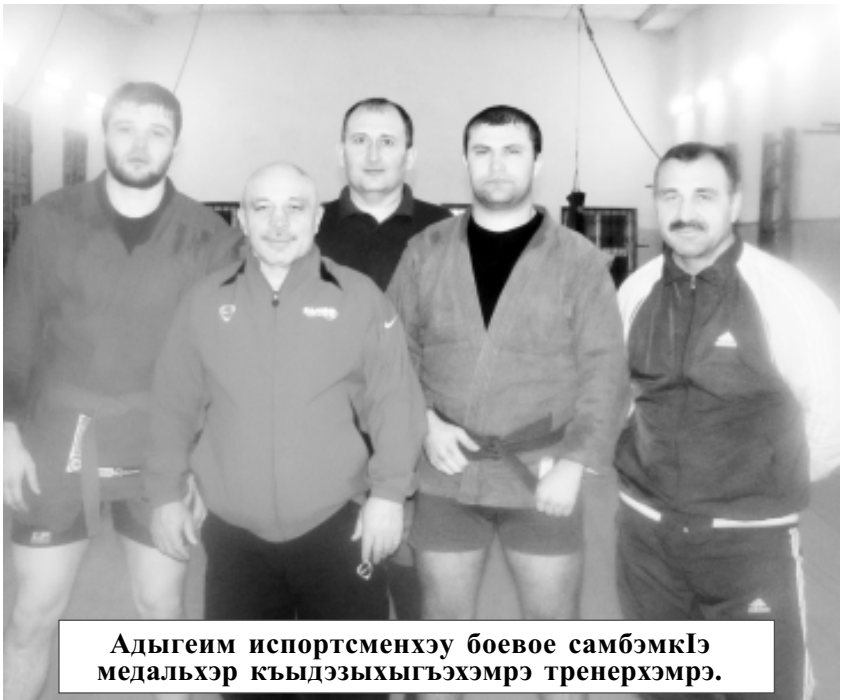
Адыгеим спортсменхэу боевое самбэмкІэ медальхэр кыдэзыхыгъэхэмрэ тренерхэмрэ.

ХагъэунэфыкІырэ чыпІэхэр кыдэзыхыгъэмэ Урысыем изэнэкъокъу зыфагъэхъазыры.