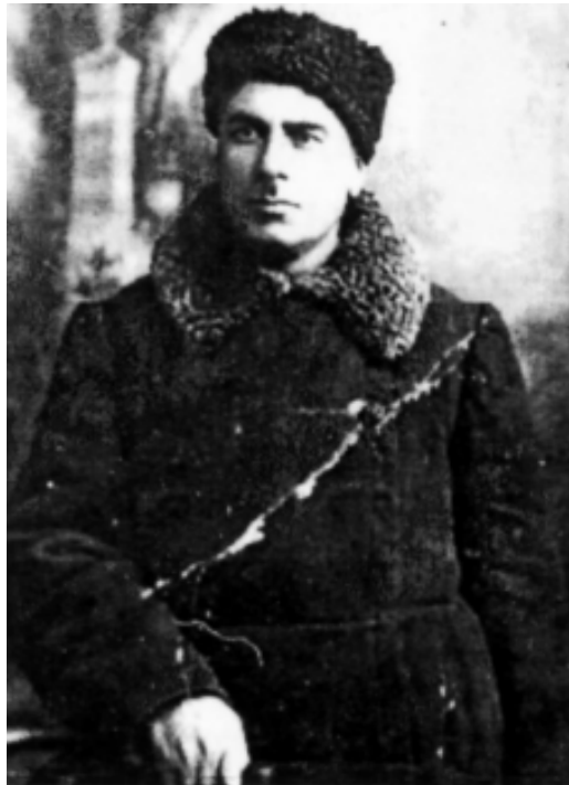
Тбилиси кIогъэгъэ купым хэтыгъэу БжэшIо Аслъанбэч.