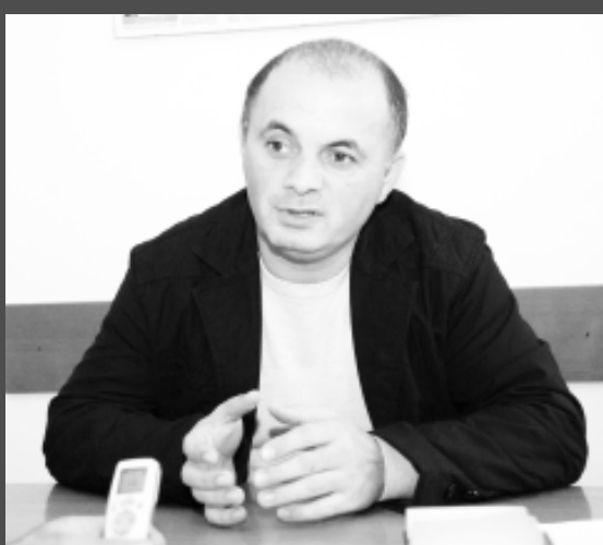
ехэм зэпыу фэмыхьоу электричествэр агъэфедэн альэкIыныу агъэпсы.

ОАО-у «Кубаньэнерго» хэхьэрэ Ады- гэ электрическэ сетьхэм кьутэмэ зэ- фэшхьафхэр, нэмыкIэу кьэпIон хьу- мэ, район электрическэ сетьхэр (РЭС) илэхэу тиреспубликэ ипсэупIэхэм, Бе- лореченскэ ыкIи Апшеронскэ район- хэри зэрэдыхэтхэу, электричествэр альегъэлэсы. ЗыкIэ ахэм ащыщ Мые- кьопэ район РЭС-у Хьунэго Валерэ зы- пашэр. Ащ пшIэрэлыгъэу иIэр зэкIэ IофшIапIи псэупIи районым итхэм зэ- пыу фэмыхьоу электроэнергетикэ алы- гъэлэсыгъэныр ары. Ащ пае РЭС-м участкэ заулэ иI: Мыекьопэ, Тульскэ, Краснооктябрьскэ, Каменномостскэ, Кужорскэ участкэхэр. Мастерыр япа- щэу участкэ пэпчэ нэбгыриплI Иоф щешIэ, электрическэ линиехэм ящы- кIэгъэ фэIо-фашIэхэр агъэцакIэх, уна- гъохэм, предприятиехэм, организаци-