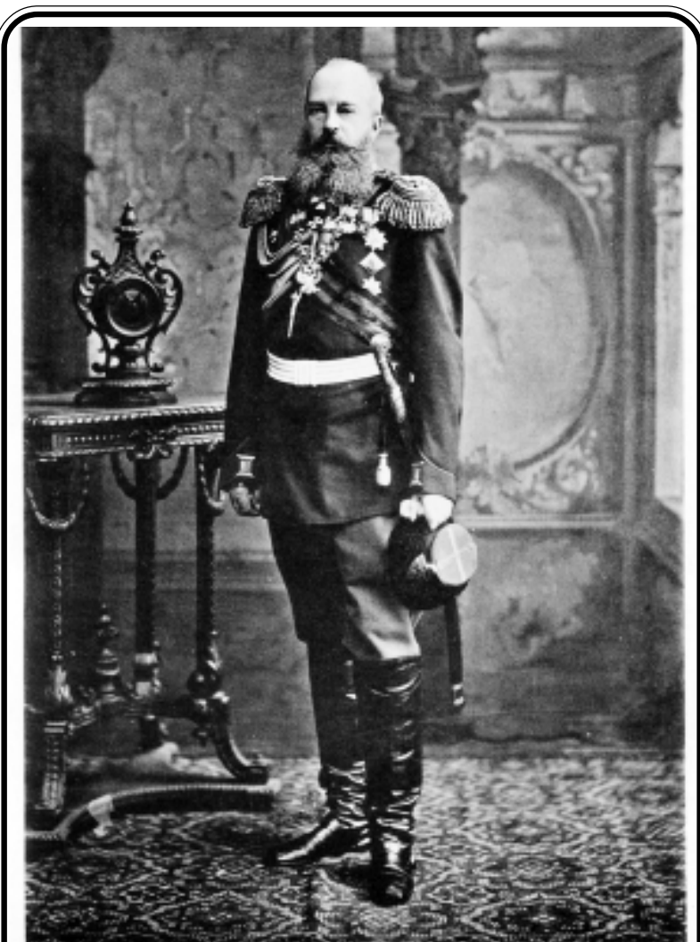
Великий князь Михаил Николаевич