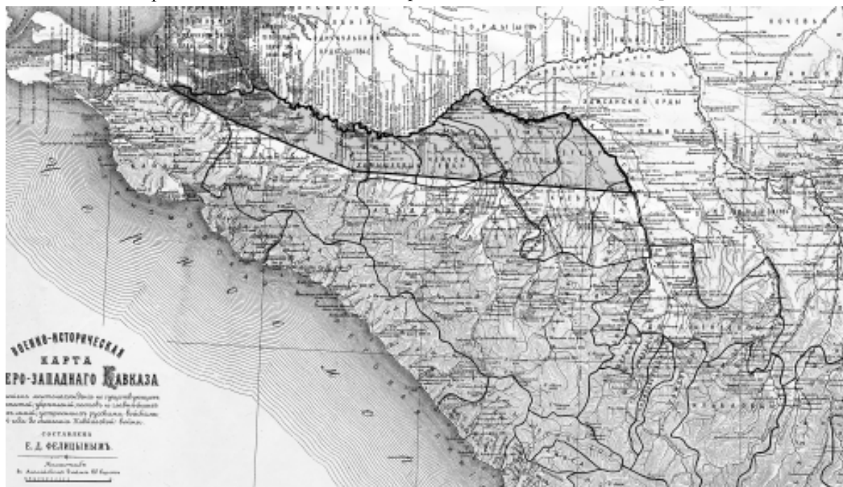
Фелицын Е. Д. Военно-историческая карта Северо-Западного Кавказа. 1898 г. Темным фоном выделена территория, которая согласно «Положению...» от 10 мая 1862 г. предназначалась для поселения адыгского населения.

Как видим, Ольшевский говорит об изгнании черкесов в Турцию, а главным инициато-