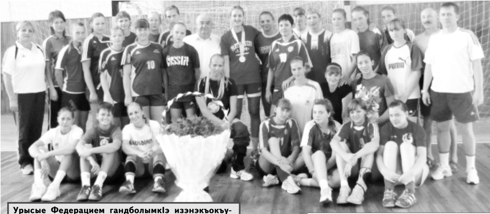
Мыекьопэ гандбол клубэу «Адыфыр».

Урысые Федерацием гандболымкIэ изэнэкьокьухэу суперлигэм цыкlorэмэ ахэлэжьэрэ командэмэ 2010 — 2011-рэ ильэс ешIэгьур Юныггом и 4-м аублэ. Мыекьопэ «Адыфым» итренер шъхьалэу, Урысыем изаслуженнэ тренерэу Александр Реввэ, тиспортсменкэмэ зэлулэгьухэр зыщырагэжьэнхэм гуцылэгьу тафэхьугь.