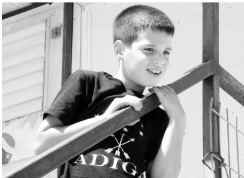
Амир илэпылэгьу шьхьалэр ащ ишэау Нухь.

пчэн 200-м ехьу шаыгь. Пчэн хьубгапхьэхэр Австрием, Францием кьащашэфыгьэх. Чыпшэ пчэн лэпкьхэри алыгыкы. Былымхэр кьэбзэ-лэабзэх, пкьыгьо лые гори нэм кьыкьидзэрэп.