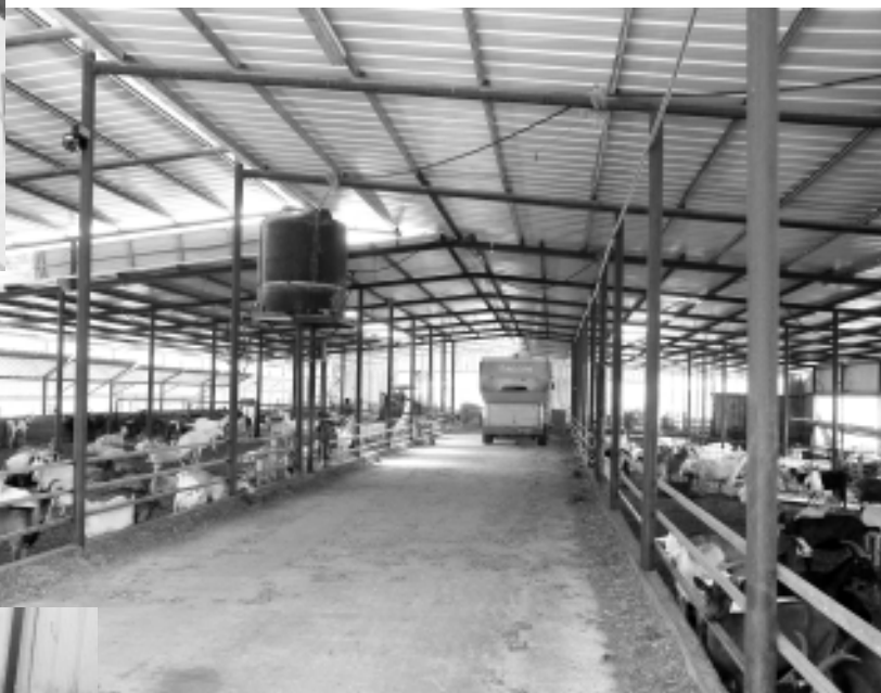
Фермэм пчэнхэр зэрэшаыгьхэр.

— Джы сэ кьызгурэю, — ело Амир, — илэситфыкэ узэклэ-бэжымэ, тытегушхуи, оборудование лэаплэр кьызытщэфым тэрэуу тызэрэжкыгьагьэр, джырэ технологиер