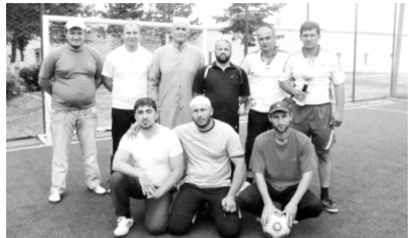
Коцхьаблэ ифутбол командэ хэтхэм ащыщхэмрэ дин- лэжьхэмрэ.