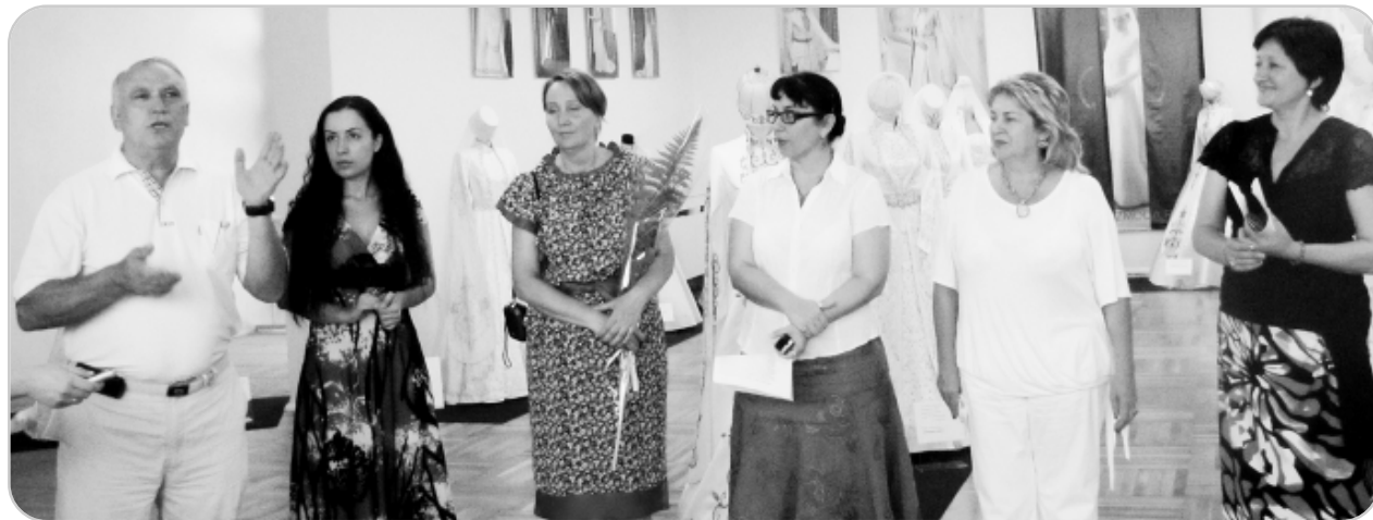
Адыгэ Республикэм и Лъэпкъ музей кьэгъэ-лъэгъоныр кыщызылауахы.

Бзылфыгъэ ныбжьыкIэу ХьацIыкIу Мадинэ Къэбэртэе-Бэлъ-