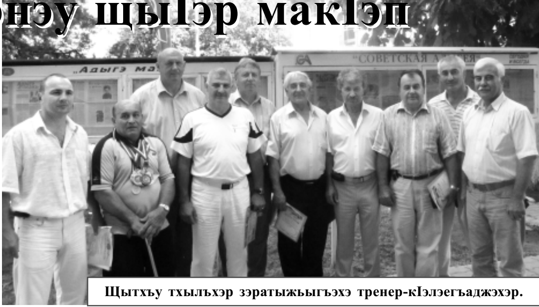
Щытхьу тхыльхэр зэратыжыгъэхэ тренер-кIэлэегъаджэхэр.