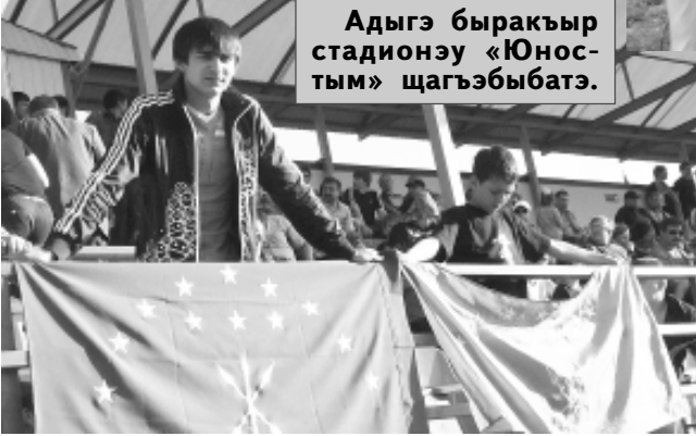
Адыгэ быракъыр стадионэу «Юность» шагъэбыбатэ.