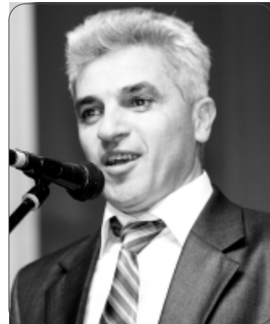
Адыгэ Республикэм щыгъупшагъэп «Шапсугием» ита-

Гъэзетэу «Шапсугием» иколлектив имэфэкиIэ кыфэгъу-шлуагъэх регион зэфэшхъафхэм ащыпсэурэ яколлегэхэр, шлуфэс телеграммэ редакцияем иколлектив кыфигъэхыгъ Урысыем ижурналистхэм я Союз итхэматэу Всеволод Богдановым. Урысыем ижурналистхэм я Союз иправление иунашъокIэ хы ШлуцIэ Iушъом щыпсэурэ адыгэхэм ягъэзет «За заслуги перед журналистским сообществом» зыфиорэ орденыр кыфагъэшъошагъ.