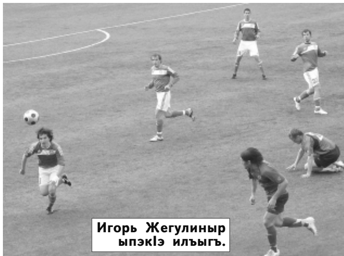
Игорь Жегулиныр ыпэкьлэ илгыгь.

Мэфитлукьэ узэкьлэIэбэжьэм, Уздэн Роман пшьэшэжьыеу