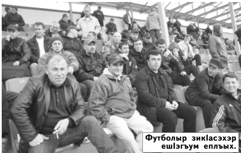
Футболыр зикласэхэр ешлэгүм еплыхь.

Кьэлапчьэм Iэгуаор дэзыдзагьэхэр: Зеленский, 3 (1:0), Жегулин, 21 (2:0), Уздэн, 81 (3:0).