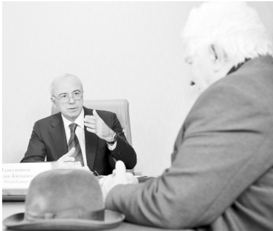
ТхъакIушынэ Аслъан Къэралыгъо Совет

Тыгъуасэ Урысые политическэ партиее «Единая Россия» зыфи- Iорэм и Апшъэрэ Совет хэтэу, Адыгэ Республикэм и Президентэу ТхъакIушынэ Аслъан «Единэ Рос- сием» и Тхъаматэу Владимир Пу- тиным ирегион общественнэ прием- нэу Мыекъуапэ кышызэIуахыгъэм цыфхэр тыгъуасэ ригъэблэгъагъэх. Мыщ фэдэу цыфхэр мы приемнэм щыригъэблэгъэнхэр зэрипшъэ- рылгыр, ау игъо зэримыфэрэм кыыхэкIыкIэ, джырэ нэс ар зэрэ- зэпымыфагъэр къекIолIагъэхэм аIуКIэныр римыгъажъзэ ТхъакIу- шынэ Аслъан кыIуагъ. Президен- тым игъусагъэх АР-м и Премьер- министрэу КъумпIыл Мурат, «Единэ Россием» и Адыгэ шъолъыр къу- тамэ иполитсовет исекретарэу Iэщэ Мухъамэд, Мыекъопэ къэлэ адми- нистрацием ипашэу, общественнэ приемнэм итхъаматэу Михаил Чер- ниченкэр.