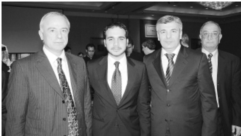
Амман, 2007-рә ильәсым имәзәе маз. Адыгеим и Президентәу ТхьакӀушыӀә Аслъан, пачыхъәм ыкьоу Алыи, Къәбәртәе-Бәлкъарым и Президентәу КъанкӀо Арсен.

къәлуатә тибысым. — Я XIX-рә лӀәшӀәгъум ятӀонәрә кӀәлӀәныкӀо зекӀолӀәхәу мыщ къыхъәгъагъәхәр Амман «адыгә чыӀәкӀә» еджәштыгъәх. ГухәкӀә Амман апәрә къәлә тхьамтиӀлӀәу иӀагъәр тилъәпкъәгъуухәу зәрәштыгъәхәр цыфхәм янахъыбә дәдәм зәрамышӀәжырәр. Адыгәхәм чыгъу Іахъышхохәр яӀагъәх, мәкъумәш хьызмәтшӀапӀәхәр зәхәщәгъагъәх, дзәм къулыкъу шахъыштыгъә, политикәм, наукәм, культурәм ІәнәтӀәшхохәр шаӀыгъыгъәх. Иорданиер шьхәафитәу шытынымкӀә адыгәхәм яшӀогъәшхо къагъәкӀуагъ.