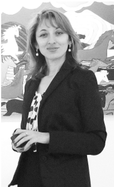
хэр кIэлэеджакIохэр ара къы-хэзыхьэр?

Темыр Кавказым имузыкант цыкIухэм я IX-рэ къэгъэлъэгъон-зэнэкьокьухэр гъэтхэпэм и 22 — 26-м ялэщтых. Адыгэ Республикэм культурэмкIэ и Министерствэ иотдел ипащэу Шэуджэн Бэлэ Iофтхьабзэм къытедгъэгушылэнэу зылудгъэклагь.